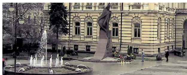
Nowy-sacz - Poland.