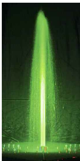
Big 5, Dubaï - UAE.