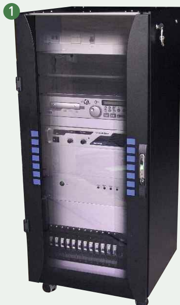
Armoire de commande et de sonorisation (FMU/FMP). Sound and control panel (UMF/PMF).