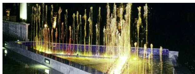
Hôtel Asdrubal, Hammamet - Tunisia.