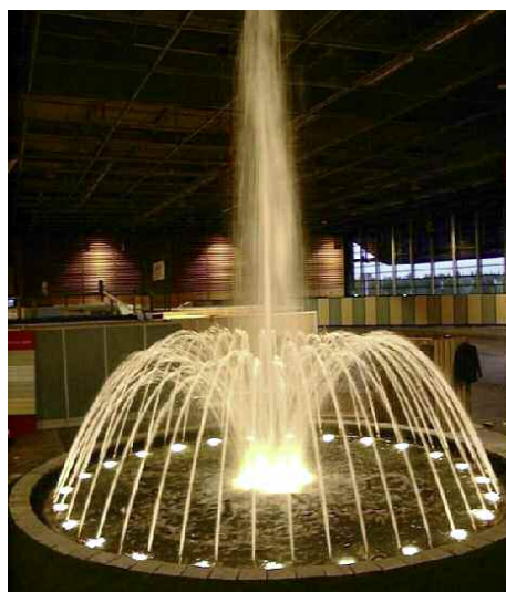
Animation Urbavert, Paris - France.

Examples of Universal Musical Fountain on line at www.aquaprim.com